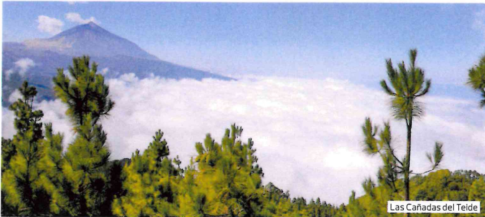
Las Cañadas del Teide