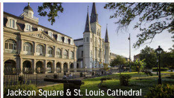
Jackson Square & St. Louis Cathedral